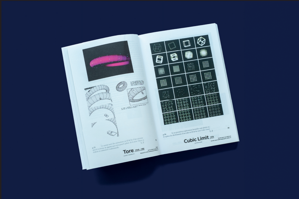
Conception graphique originale d'un livre

Etienne Macquet 30 rue carnot 94270 Le Kremlin Bicêtre +33 (0) 6 13 87 19 92 studio@etiennemacquet.com École nationale supérieure des arts décoratifs (ENSAD) 31 rue d'Ulm 75005 Paris